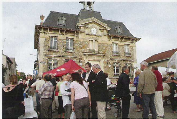
Fête Patronale des 24 et 25 mai