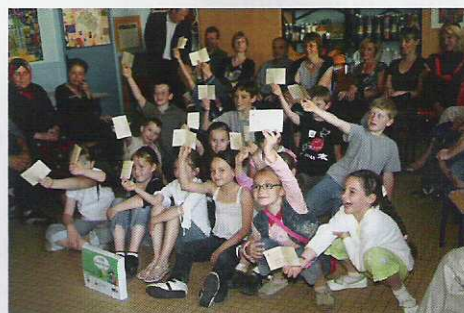
Remise du permis piéton à l'école Jean Moulin

Le permis de lotir « des jardins de la Grande Rue », rue du Luxembourg a été déposé en mairie et est en cours d'instruction.